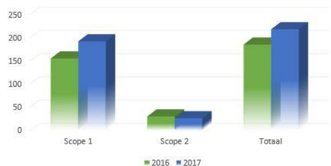
Verhouding scope 1 en 2 over 2016 en 2017 gecombineerd